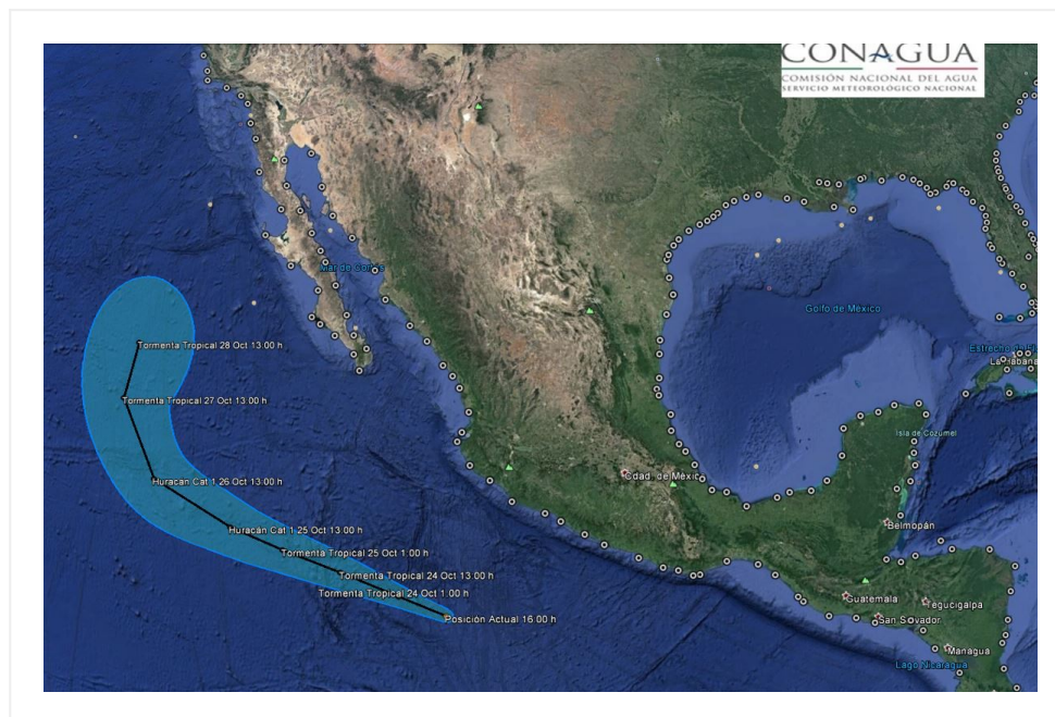
Trayectoria pronóstico de la tormenta tropical SEYMOUR